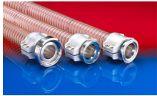
CONNECT SAFETY CLAMP ASSEMBLY 231