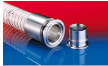
CONNECT PRESS ASSEMBLY 232