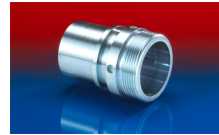
CONNECT THREAD FITTING 234