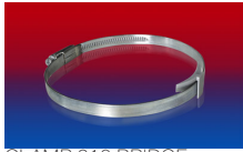
CLAMP 210 BRIDGE CLAMP