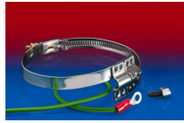
CLAMP 212 EC