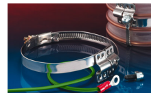
CLAMP 212 EC