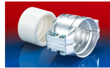
CONNECT SAFETY CLAMP ASSEMBLY 231