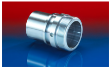
CONNECT THREAD FITTING 234