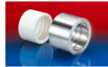
CONNECT PRESS ASSEMBLY 232