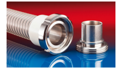
CONNECT MOULD ASSEMBLY 233