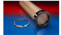
CONNECT 245 VAC-TRUCK