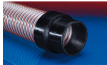
CONNECT 240 + 241