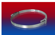
CLAMP 210 BRIDGE CLAMP